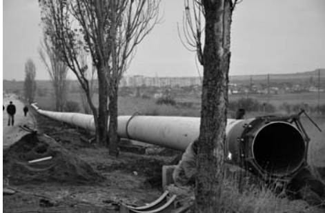
Нижний Солнечный ждёт ремонта водовода

Водоснабжение Керчи – большой вопрос как для жителей города, так и для властей. Стратегический план экономического развития Керчи до 2015 г., разработанный