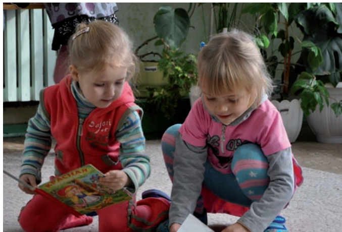
Книги становятся красочнее

Попросите ребенка нарисовать вашу семью. В рисунке ребенок отражает отношение к нему, своё отношение к родителям и окружающему миру. Обратите на это внимание: вы увидите, хватает ли ему любви, есть ли у вашего ребенка какие-то желания. Больше общайтесь, ходите в парк, гуляйте у моря, кормите чаек. Это занимает немного времени, но для ребенка это будут колоссальные впечатления.