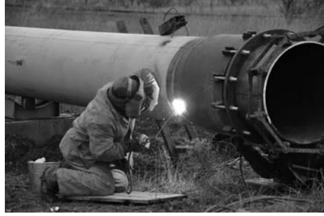
Рабочие хотят успеть до Нового года

развитию (USAID) «Локальные инвестиции и национальная конкурентоспособность», в пункте «Улучшение городской среды» особое внимание уделяет обеспечению развития современных сетей водоснабжения и водоотведения в городе и улучшения качества питьевой воды. Согласно документу,