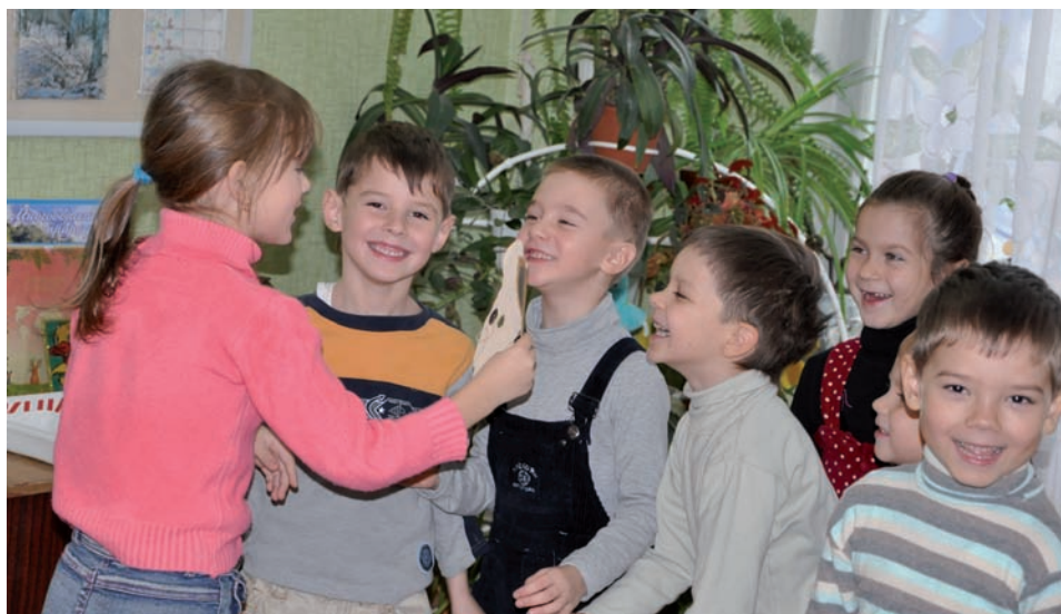
«У медведя во бору» - игра XXI века