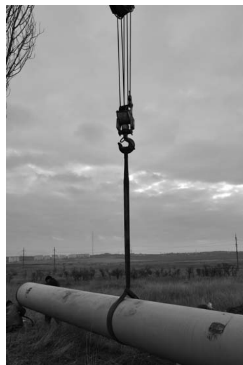
К старому отрезку водовода привозят новые трубы

на эти цели в 2010 году было запланировано выделить из городского бюджета 75 млн. грн. Деньги на замену водовода выделило правительство. Совет министров АРК распределил средства резервного фонда Государственного бюджета Украины для проведения аварийно-восстановительных работ по ликвидации последствий чрезвычайной ситуации, произошедшей на магистральном водоводе Керчи. По информации министра экономики Крыма