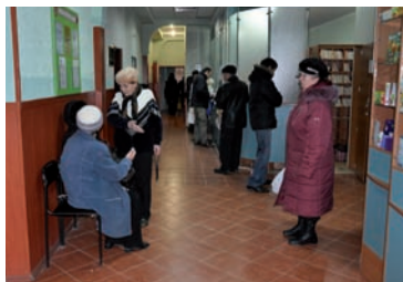
Портовая больница обслуживает много пожилых людей